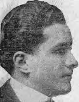
DON J. RAFAEL OREAMUNO

EL SECRETARIO DE ESTADO ASISTENTE, BRADEN, Y EL NUEVO EMBAJADOR EN RIO DE JANEIRO PAWLEY, HICIERON LA PETICION. — BRADEN SE DISPUSO A PLANTEAR A TRUMAN LA PETICION DESPUES DE CONFERENCIAR CON LOS EMBAJADORES DE 14 PAISES AMERICANOS PRODUCTORES DE CAFE